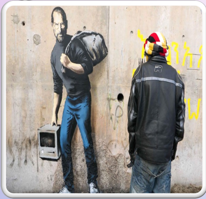
BANKSY: "STEVE JOBS HUYENDO DE SIRIA"