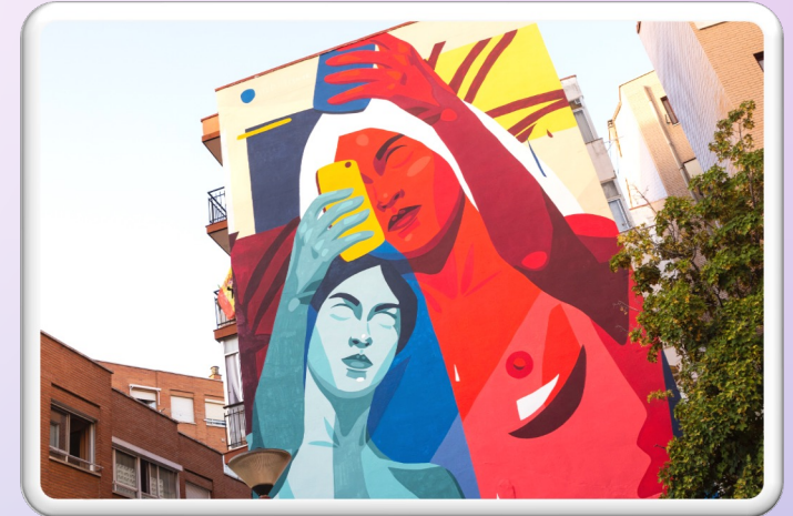
"EL SELFIE (9:16)", DIEGO VICENTE 2020 NECESITAMOS TRABAJAR

Se identifica como una de las áreas menos trabajadas. Posible necesidad: reforzar el área para estimular la aparición de nuevos intereses vinculados al ocio valioso.