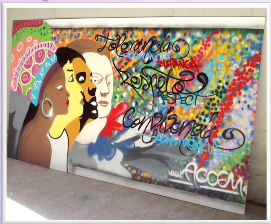
Mural elaborado con la colaboración de la asociación juvenil aeroart