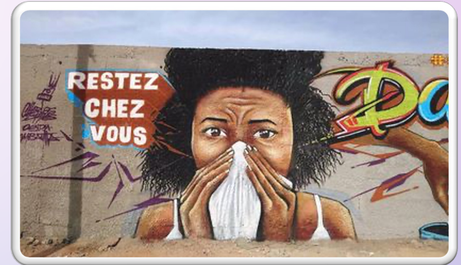
"Quedaos en casa"

Posible necesidad: reforzar las actuaciones orientadas a prestar atención psicológica. Propósito apoyar el escenario favorable destacado de continuar con los procesos psicoemocionales.